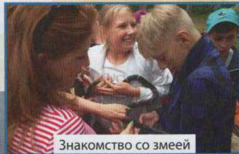
Знакомство со змеей